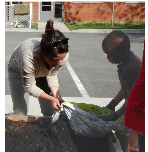
Adultes et enfants ont travaillé ensemble pour créer les jardins collectifs aux habitations Meunier-Tolhurst.

Pour la liste des projets subventionnés par ID 2 EM, consultez le tableau en page 4.