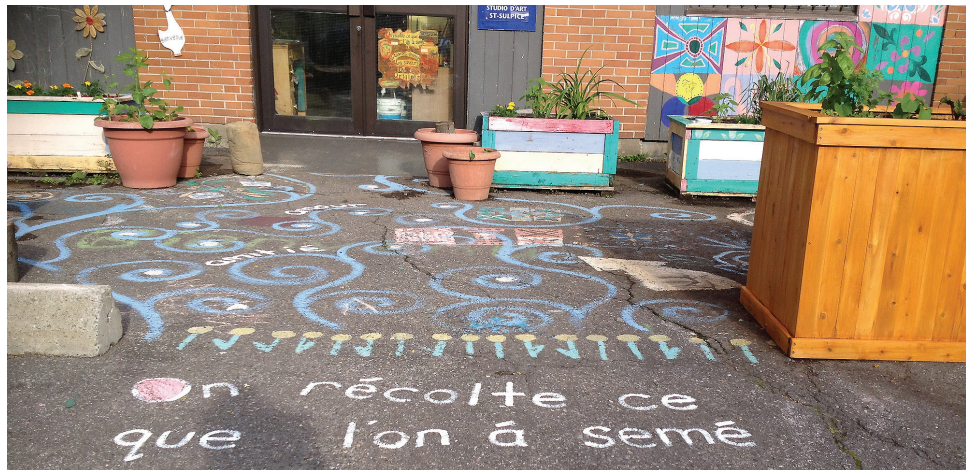
Depuis la création du studio d'art aux habitations Saint-Sulpice, l'art déborde même sur l'asphalte!

Des projets retenus par la SHQ, six constituent une continuation ou une bonification du travail amorcé les années