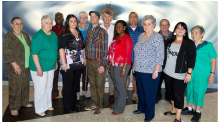
Élus en décembre 2013, les membres du Comité consultatif des résidents ont présenté leur premier bilan le 23 octobre 2014, à l'occasion de l'assemblée générale annuelle.

À la fin, plusieurs représentants ont tenu à remercier le CCR pour son travail consciencieux et la richesse de contenu de l'assemblée, plus informative que jamais.