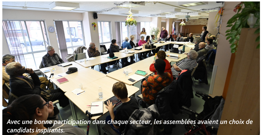
Avec une bonne participation dans chaque secteur, les assemblées avaient un choix de candidats inspirants.

Lors des mêmes assemblées, les représentants de locataires ont élu les membres du comité d'audit pour un mandat de deux ans. Deux ou trois fois par an, ces locataires sont invités à évaluer bénévolement l'état général et l'entretien d'immeubles choisis au hasard dans un secteur autre que le leur. Ils sont accompagnés dans cette tâche par des gestionnaires de l'OMHM. Leur rapport oriente la Direction de la gestion des HLM dans l'amélioration de ses services.