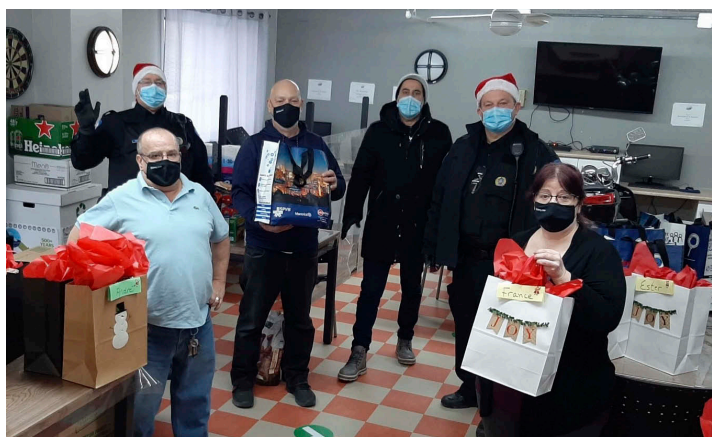
Les policiers du quartier collaborent avec le comité des habitations de l'Érablière, comme ici, pour distribuer des paniers de Noël. C'est cette confiance entre les divers intervenants qui a permis au plan d'action intégré de la Petite-Bourgogne de voir le jour.

Un plan d'action se prépare, voilà ce qu'il s'y passe ! Plusieurs comités de locataires, des organismes communautaires et des représentants d'institutions collaborent afin de créer un quartier où se répandra la sécurité alimentaire, sociale et sanitaire.