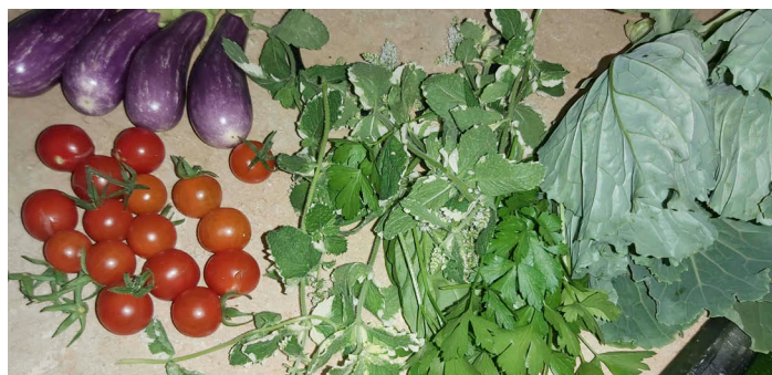
La récolte était abondante et variée l'an dernier dans le jardin potager des habitations Robert-Papin.