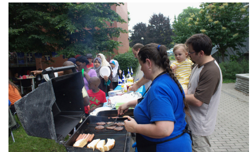
...mais aussi favoriser la bonne entente dans leur milieu de vie en organisant des repas communautaires...