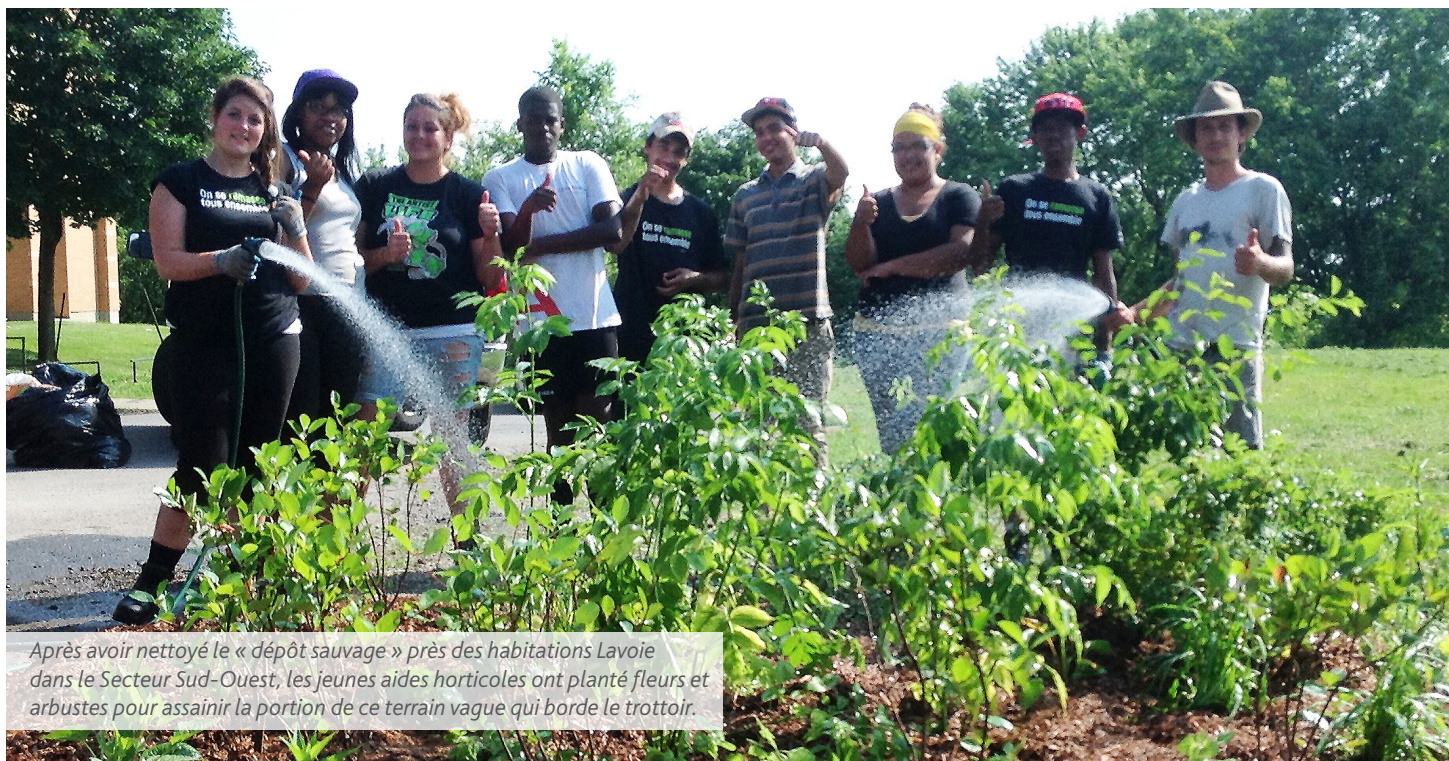
Après avoir nettoyé le « dépôt sauvage » près des habitations Lavoie dans le Secteur Sud-Ouest, les jeunes aides horticoles ont planté fleurs et arbustes pour assainir la portion de ce terrain vague qui borde le trottoir.