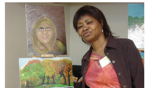
...et veiller à ce que les individus s'épanouissent, par exemple dans un cours de peinture où ils découvrent leur talent.