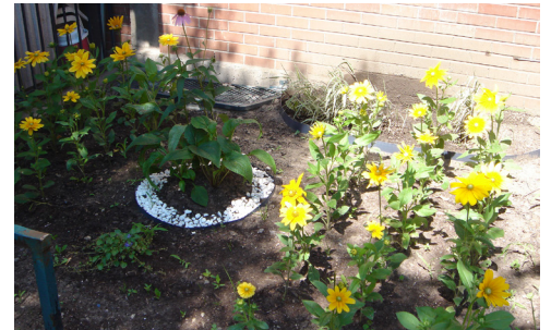
Pour le « collectif » Des Fleurs, De l'Érablière, Richmond et Albert, le développement durable, ça veut dire prendre soin de l'environnement...