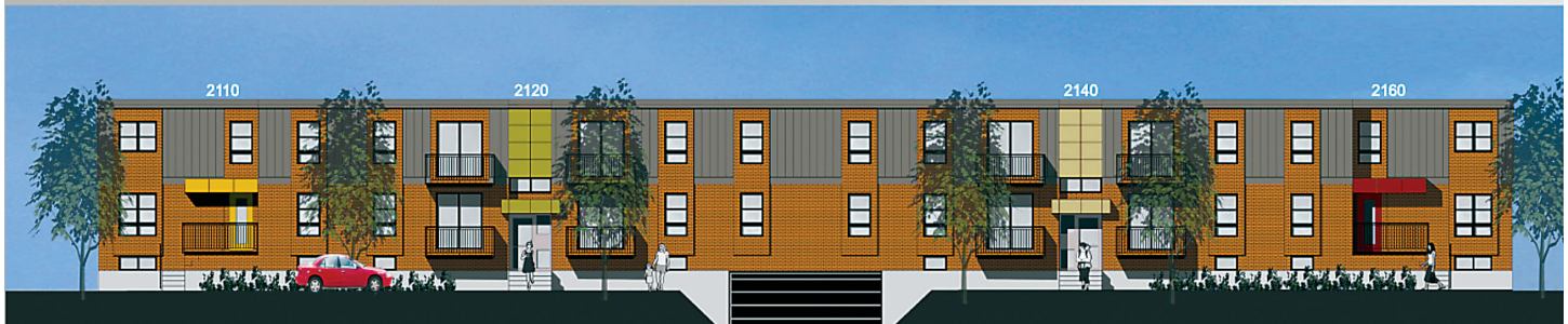
BÂTIMENT 4 - RUE WORKMAN

Vos commentaires nous ont permis d'ajouter les éléments suivants aux travaux :