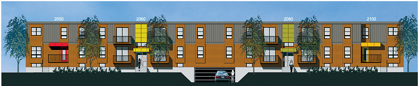
BÂTIMENT 5 - RUE WORKMAN

Les chiffres au-dessus des bâtiments représentent les adresses de la rue Workman.