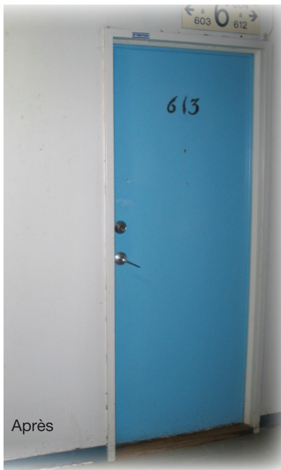
Corridor dégagé, prêt pour les travaux.

Au moment des travaux, vous devez retirer tout ce qui se trouve sur le plancher.