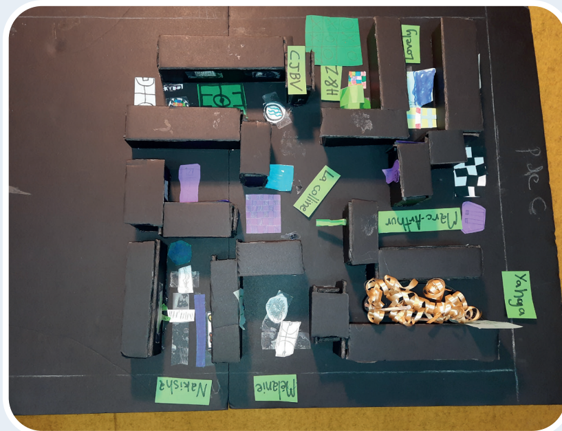
Maquette réalisée par les enfants de 5 à 12 ans

https://fr.surveymonkey.com/r/Boyce-viau