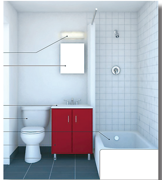
Votre future salle de bain