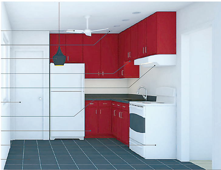
Votre future cuisine