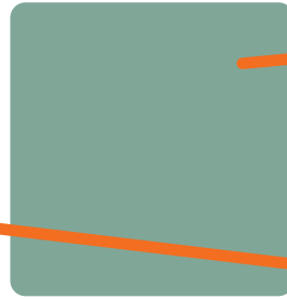
Boiseries - COULEUR 2 Vert clair