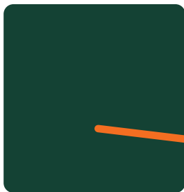
Boiseries - COULEUR 1 Vert foncé