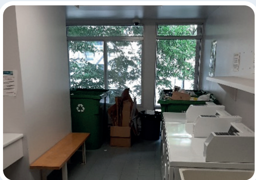
Emplacement actuel des bacs de recyclage