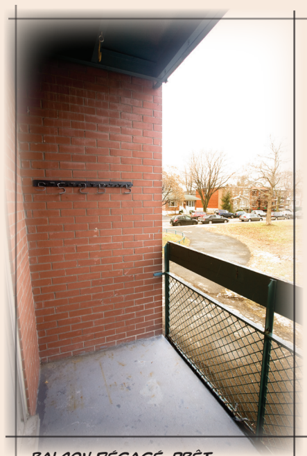
BALCON DÉGAGÉ, PRÊT POUR LES TRAVAUX.