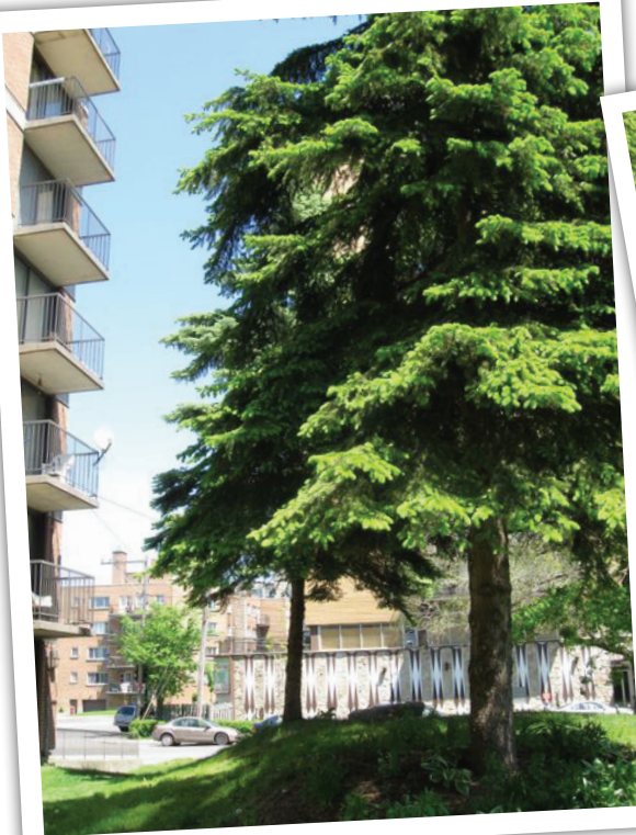
Le conifère à l'entrée de la cour qui devra être déplacé à cause des travaux d'excavation sera replanté ou remplacé.