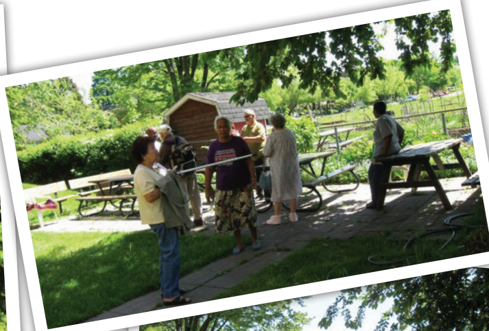
Les locataires ont profité d'une belle journée pour sortir dans le jardin et parler des améliorations qu'ils souhaitaient.