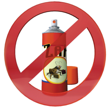
N'utilisez pas d'insecticides.