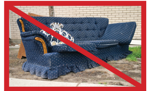
Ne jetez pas vos meubles.

Saviez-vous que l'extermination des punaises de lit est une responsabilité partagée par l'expert en extermination, l'OMHM et les locataires? Sans une bonne préparation, le traitement ne sert à rien. Si vous avez besoin de conseils ou d'explications, communiquez avec le centre d'appels de l'OMHM et demandez à parler à l'agent d'intervention à la salubrité affecté à votre secteur.